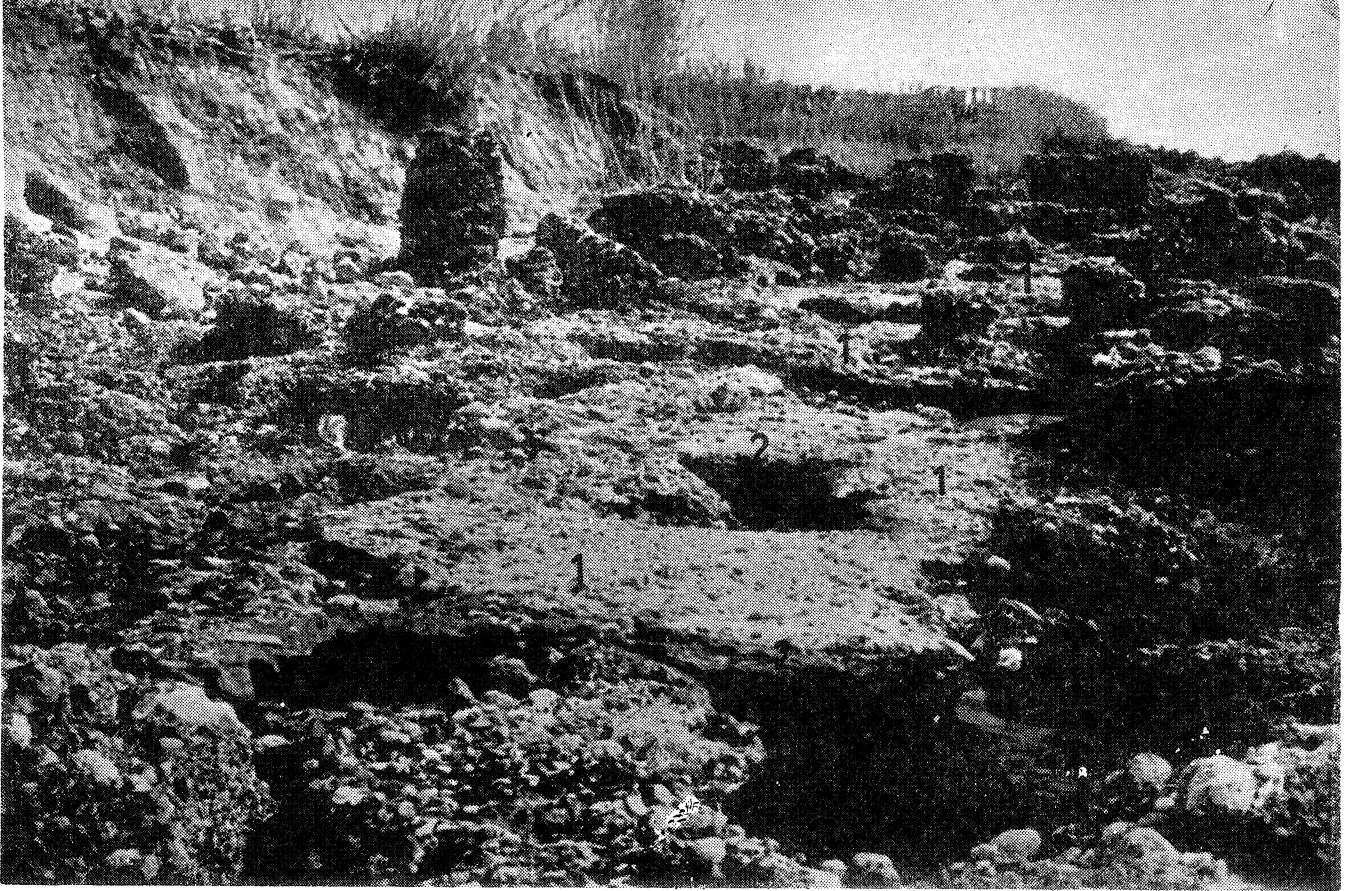
Şekil 4 : Fiğla burnunda Plio - Pleistosen konglomeralar üzerinde şekillenmiş biyo - erozyon platformu (1). Platform üzerindeki kaya oyuklarının kenarları Çiğ kalker alglerinin iskelelerinden oluşan çerçevelerle (rim'lerle) çevrilmiştir (2). Bunların yaşamları, platformun 0.5 m kadar yükselmesiyle, yaklaşık 1550 yıl önce sona ermiştir. (Şekil 3 ile karşılaştırınız)